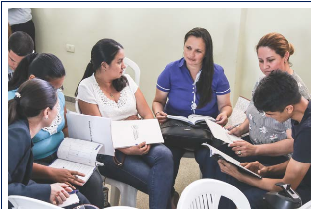
Seminario Emprendiendo en el Mundo de las TIC- CDE